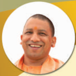
योगी आदित्यनाथ माननीय मुख्यमंत्री, उत्तर प्रदेश